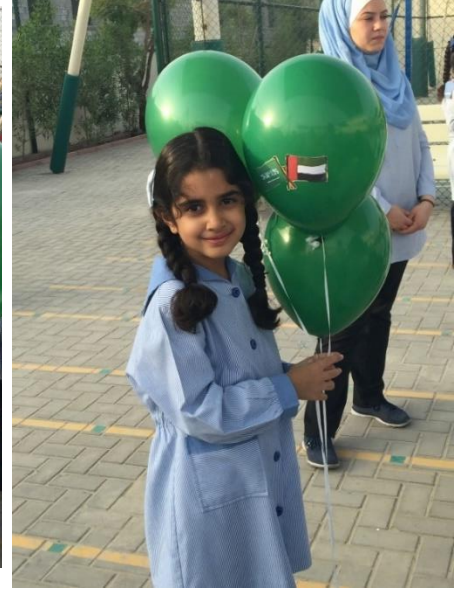
طلاب الصف الثاني يحتفلون باليوم الوطني السعودي

رفع بالونات خضراء وضعت عليها العلم السعودي والعلم الإماراتي .